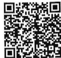
QR Code Infographic